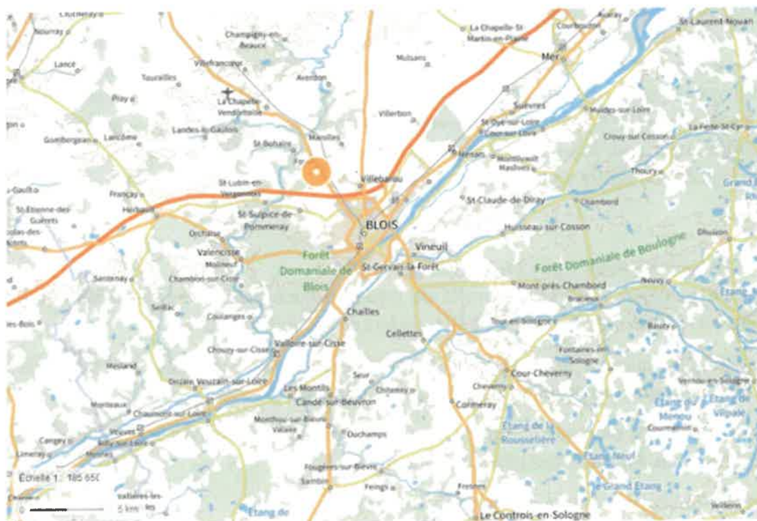
Localisation de la commune de Fossé

DDAE présenté par la société SUEZ RC Centre-Ouest en vue de créer une plateforme de préparation des déchets haut PCI au sein de son centre de tri transfert de FOSSÉ