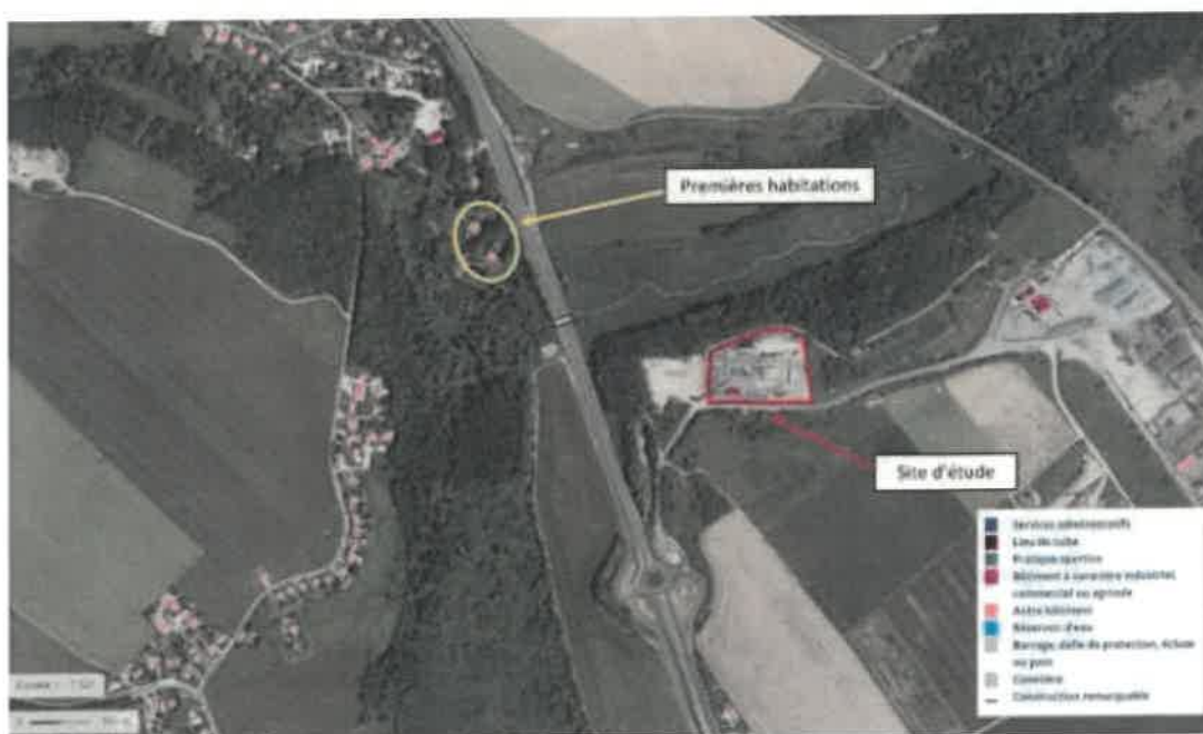
Figure 44 : Cartographie des premières habitations

Les premières habitations les plus proches sont situées à environ 400 mètres à l'Ouest du site d'étude.