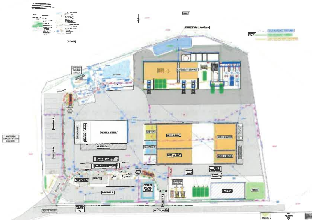
Figure 4 : Plan de la réorganisation des stockages actuels

La création d'une plateforme de préparation des déchets haut PCI permettra à la région Centre-Val de Loire de disposer d'une filière de valorisation énergétique adaptée pour répondre aux besoins du territoire. Le site permettra en particulier d'approvisionner la nouvelle Ligne de Valorisation Énergétique de Valcange à Blois (41) dont la mise en service est prévue au deuxième semestre de l'année 2026. Le projet participera ainsi à l'objectif de disposer d'une solution pérenne de valorisation des déchets non recyclables et d'en réduire l'enfouissement. Le projet sera développé sur le terrain de 17 397 m 2 déjà exploité depuis 2008 par la société SUEZ RV Centre Ouest.